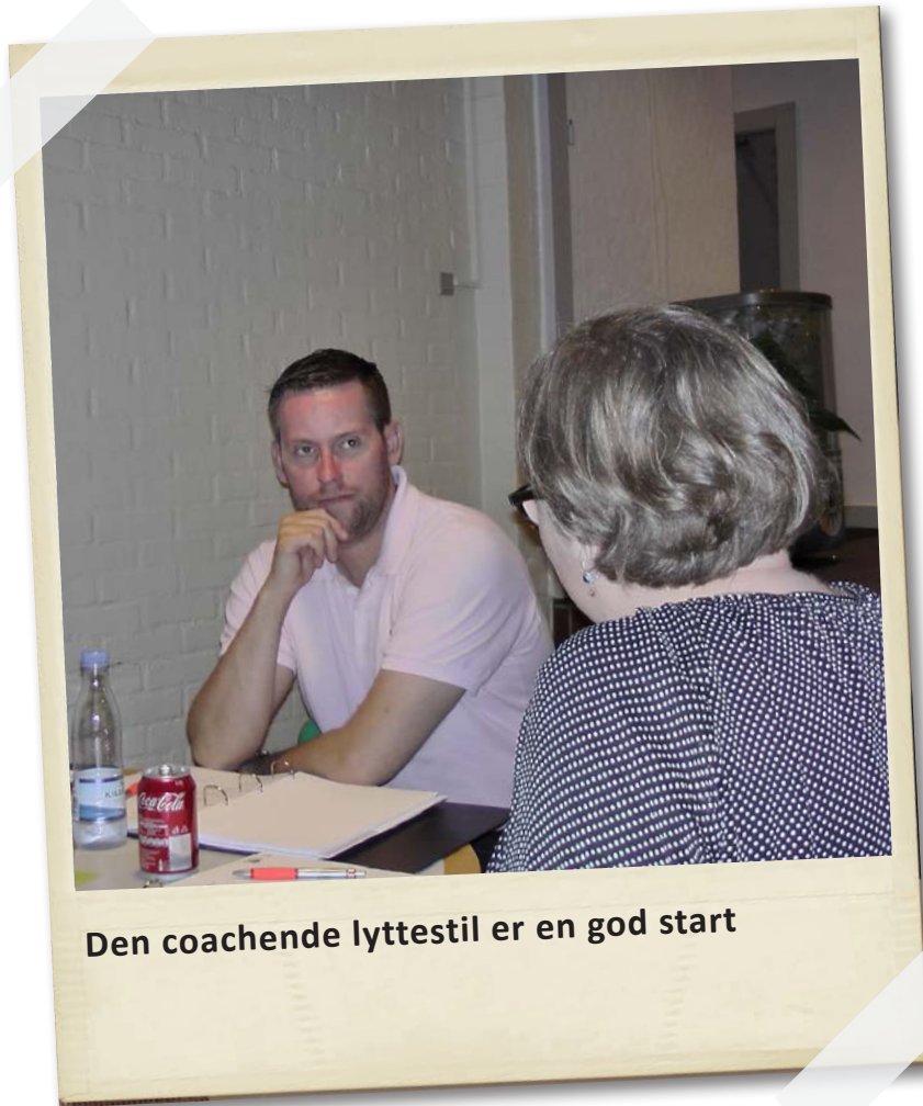
Den coachende lyttestil er en god start